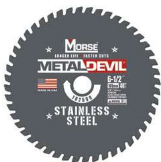
Lama grigia: 137, 150, 165, 184, 203, 229 mm