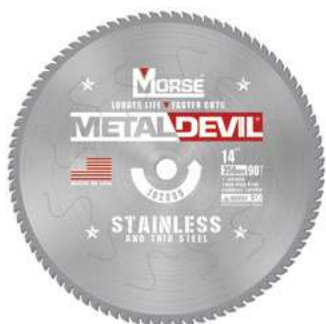
Lama lucida: 305, 356 mm